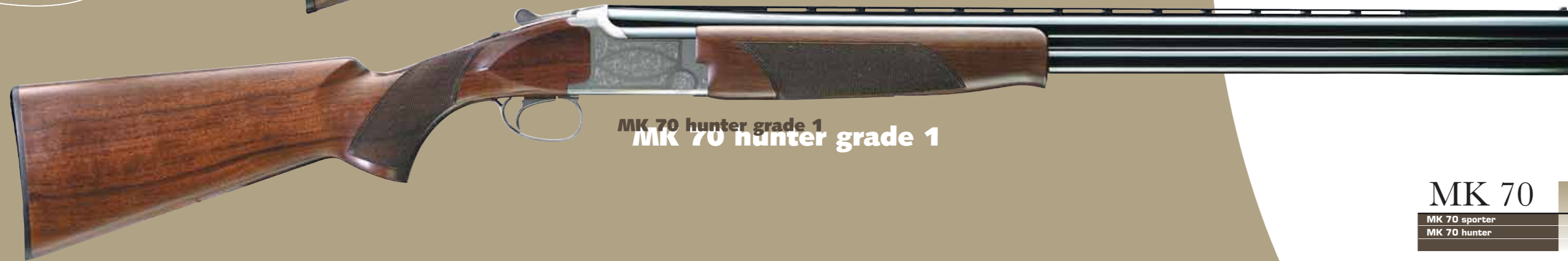
MK 70 hunter grade 1

FR Muni de chokes amovibles Invector qui lui permettent de s'adapter à tous les types de plateaux, le MK70 Sporter a été dessiné spécifiquement pour le Parcours de Chasse. Il est disponible en différentes longueurs de canons et des niveaux de finition différents lui confèrent une élégance toute classique.