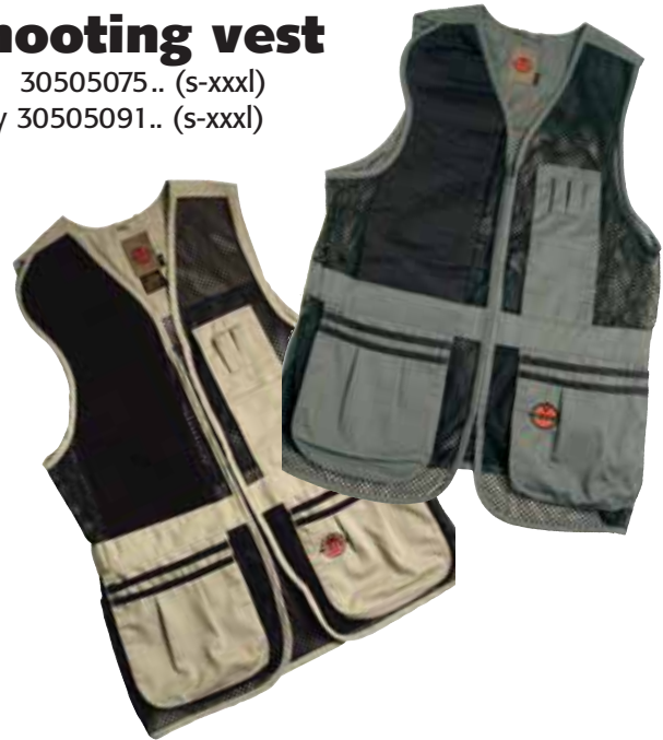
Tan 30505075.. (s-xxxl) Grey 30505091.. (s-xxxl)