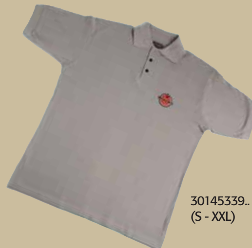
30145339.. (S - XXL)