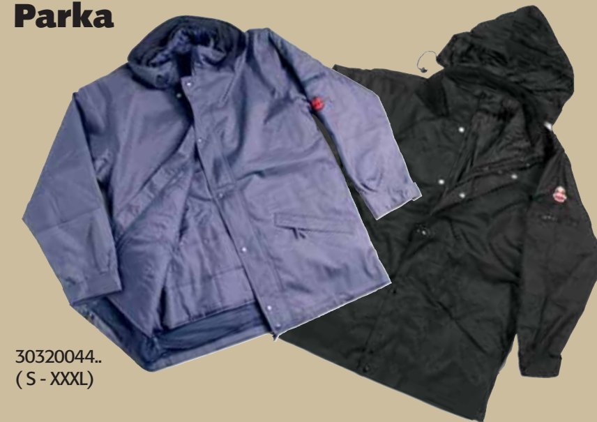
30320044.. (S - XXXL)