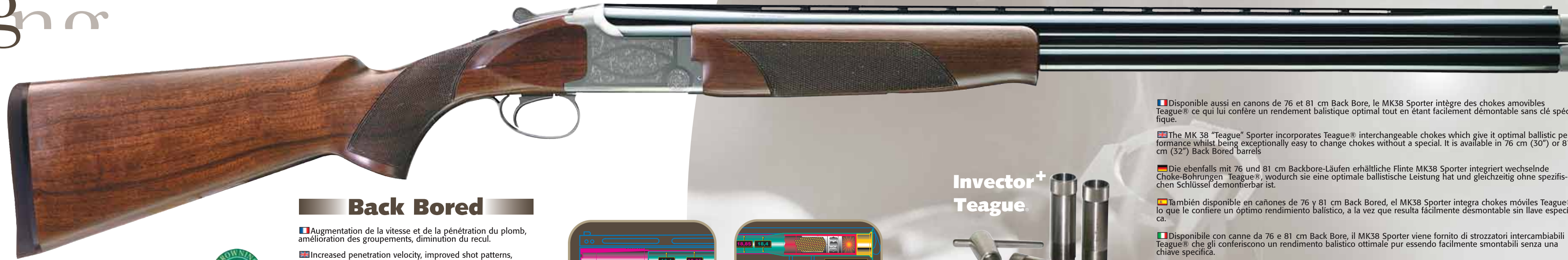
MK 38 sporter Teague MK 38 sporter Teague

Disponibile con canna da 76 e 81 cm, questo fucile riunisce tutte le qualità che hanno determinato la fama del MK38, adattate però alla disciplina del Percorso da Caccia. La sua canna Back Bore riduce sensibilmente il rinculo, garantendo allo stesso tempo una rosata eccezionale.