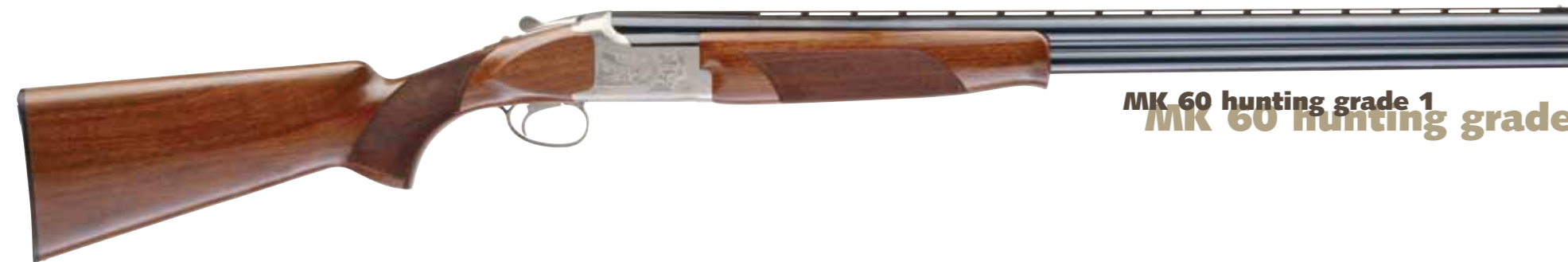
MK 60 hunting grade 1

■ Avec le MK60 "Game & Target", Miroku procure aux chasseurs et aux tireurs l'arme polyvalente par excellence, aussi à l'aise en action de chasse que sur une planche de parcours de chasse. Il est disponible en Cal 12 et Cal 20 magnum, en plusieurs longueurs de canon, avec trois finitions différentes (Grade 1, 3 et 5).