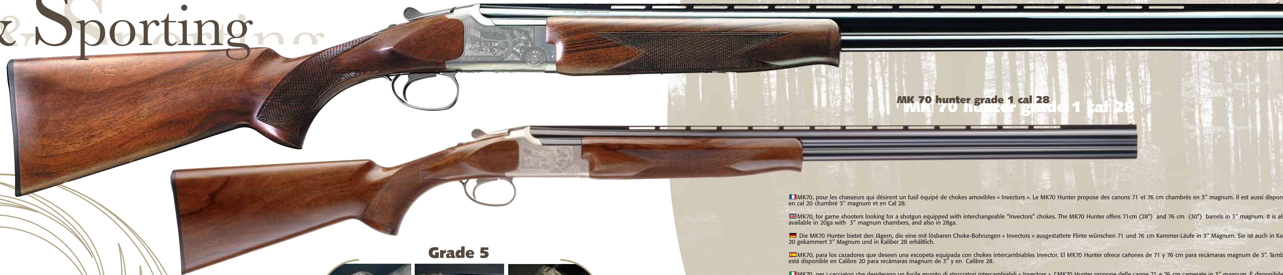
MK 70 hunter grade 1 cal 20 M