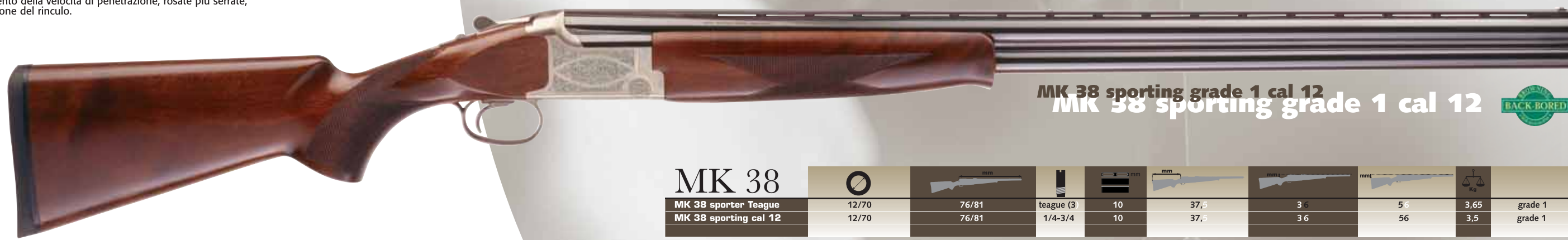
MK 38 sporting grade 1 cal 12 MK 38 sporting grade 1 cal 12