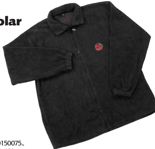
30150075.. S to XX