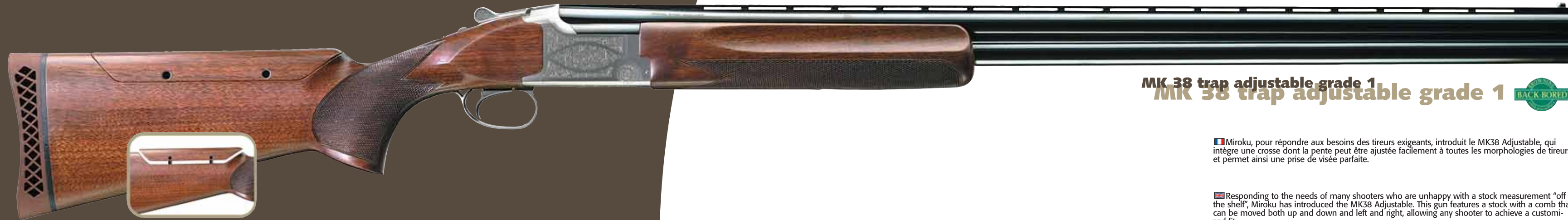
MK 38 trap adjustable grade 1

Il MK38 Trap si è imposto sulle pedane di tiro come una dei migliori fucili per il Trap. È disponibile in vari gradi di finiture (1, 3 e 5) che si distinguono dalla accurata scelta dei legni e dalla qualità delle incisioni.