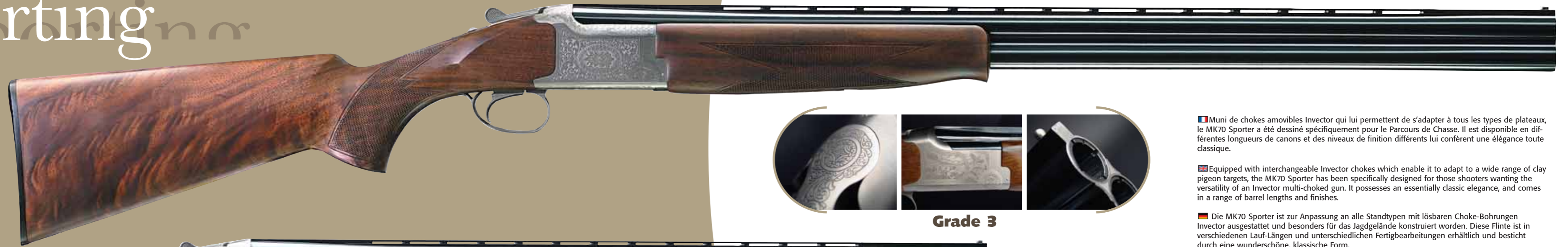
MK 70 sporter grade 3