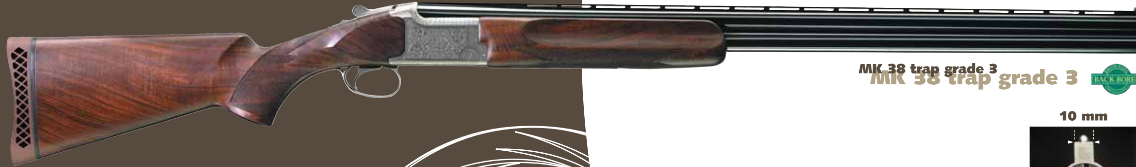
MK 38 trap grade 3

Miroku, al fine di rispondere alle necessità dei tiratori più esigenti, introduce il MK38 Adjustable, che integra un calcio il cui pitch può essere facilmente adattato a tutte le morfologie dei tiratori e consentire così una linea di mira ottimale.