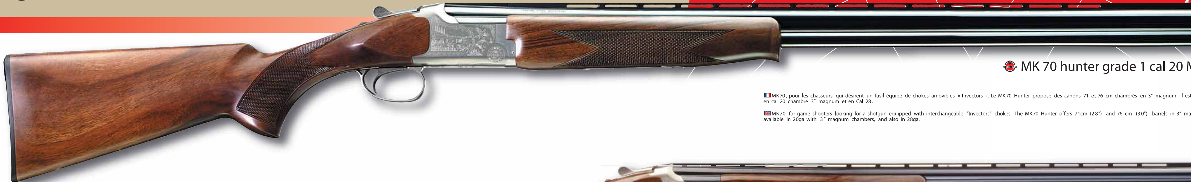
MIROKU MK 70 hunter grade 1 cal 20 M

MK70, pour les chasseurs qui désirent un fusil équipé de chokes amovibles « Invector ». Le MK70 Hunter propose des canons 71 et 76 cm chambrés en 3" magnum. Il est aussi disponible en cal 20 chambré 3" magnum et en Cal 28.