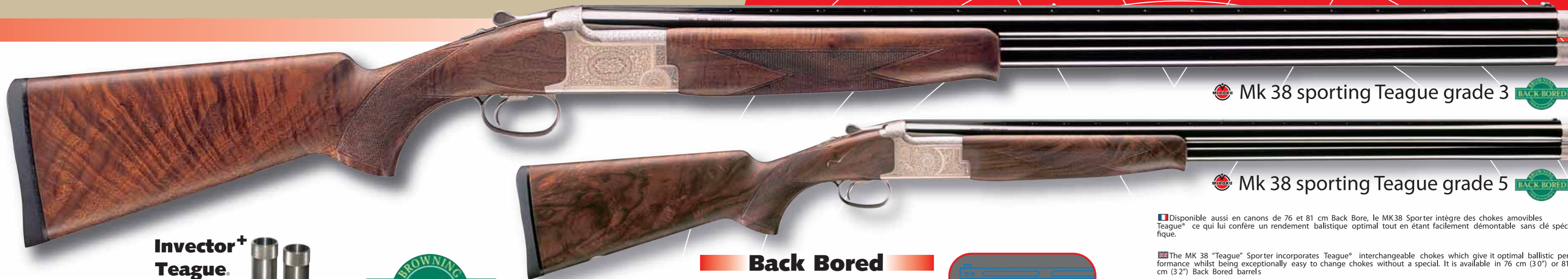
Mk 38 sporting Teague grade 3

Il Miroku MK38 è considerato dai tiratori di Fossa Olimpica come uno dei migliori attrezzi della sua categoria. Anche i Tiratori di Percorso da Caccia hanno ora un valido strumento nella loro disciplina, poiché Miroku introduce le versioni Sporting e Sporter Teague®.