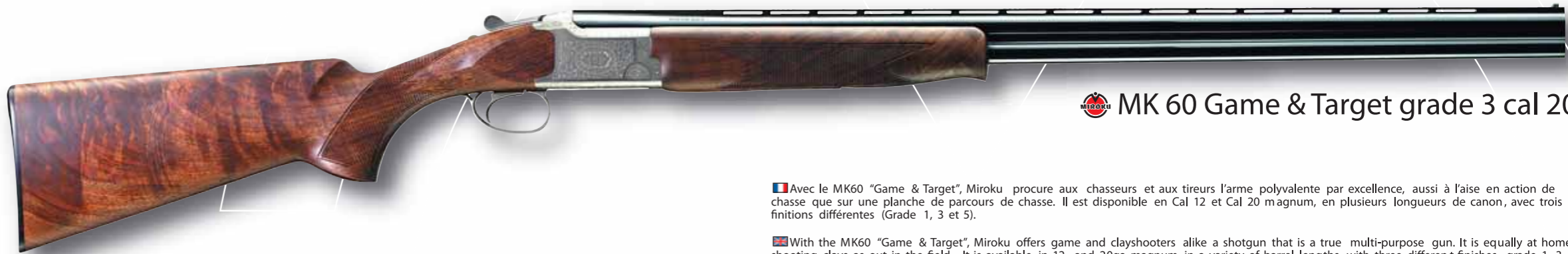
MK 60 Game & Target grade 3 cal 20