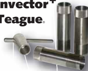
Invector + Teague.