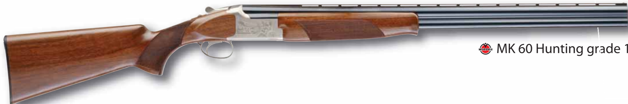
MK 60 Hunting grade 1

Questo fucile da caccia leggero (circa 3 Kg) è disponibile con strozzature fisse e canne da 66 o 71 cm. Dotato di un monogrillo selettivo, ha un calcio a pistola allungata e un guardiamano a tulipano. Leggero da trasportare, ben equilibrato e facile da brandeggiare.