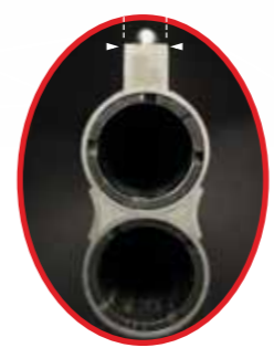
MIROKU MK 38 trap grade 5 BACK-BORED