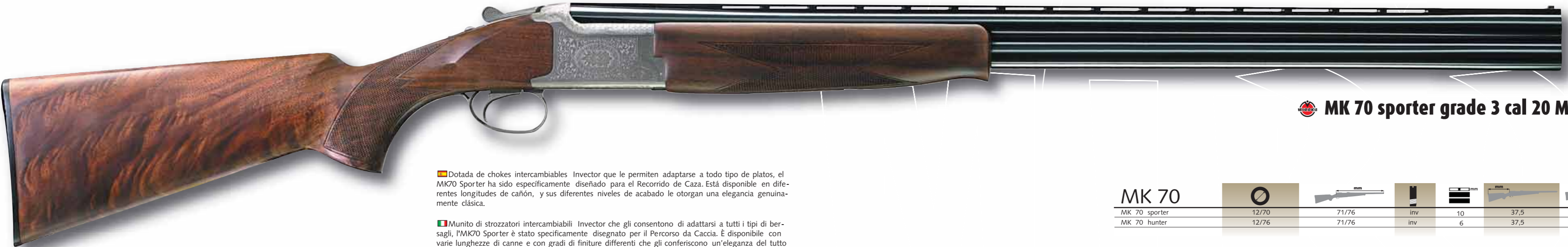
MK 70 sporter grade 3 cal 20 M

■ Dotada de chokes intercambiables Invector que le permiten adaptarse a todo tipo de platos, el MK70 Sporter ha sido específicamente diseñado para el Recorrido de Caza. Está disponible en diferentes longitudes de cañón, y sus diferentes niveles de acabado le otorgan una elegancia genuinamente clásica.