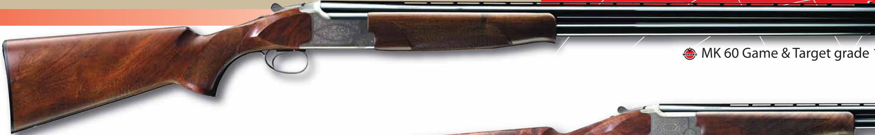
MK 60 Game & Target grade 1