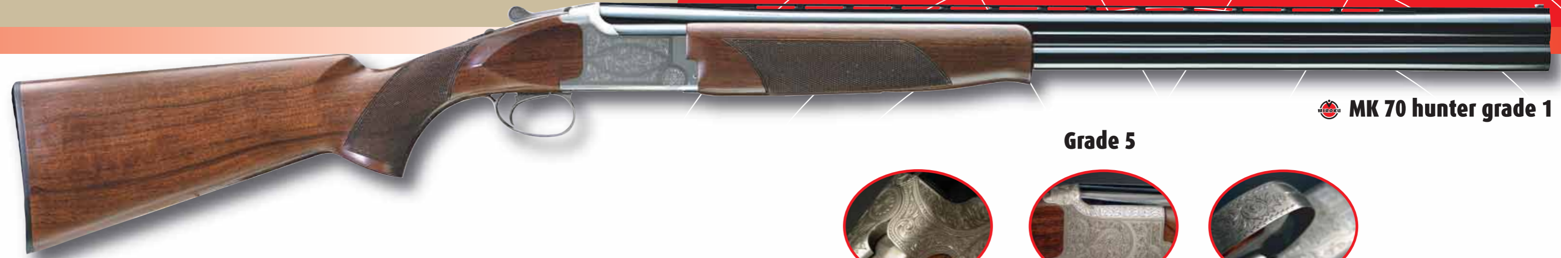
MK 70 hunter grade 1

■ Muni de chokes amovibles Invector qui lui permettent de s'adapter à tous les types de plateaux, le MK70 Sporter a été dessiné spécifiquement pour le Parcours de Chasse. Il est disponible en différentes longueurs de canons et des niveaux de finition différents lui confèrent une élégance toute classique.