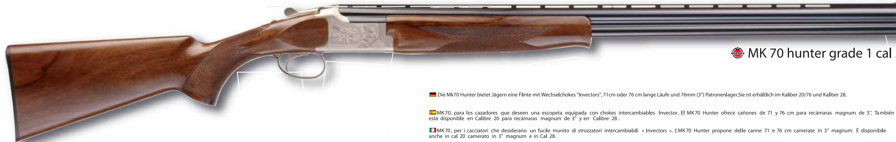
MIROKU MK 70 hunter grade 1 cal 28

Die Mk70 Hunter bietet Jägern eine Flinte mit Wechselchokes "Invector", 71cm oder 76 cm lange Läufe und 76mm (3") Patronenlager. Sie ist erhältlich im Kaliber 20/76 und Kaliber 28.