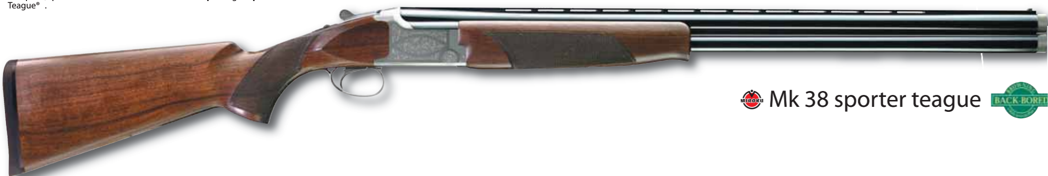
Mk 38 sporter teague

Disponibile con canne da 76 e 81 cm Back Bore, il MK38 Sporter viene fornito di strozzatori intercambiabili Teague® che gli conferiscono un rendimento balistico ottimale pur essendo facilmente smontabili senza una chiave specifica.