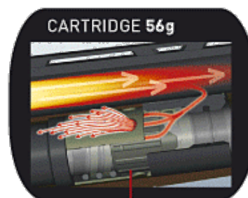
ACTIVE VALVE SYSTEM