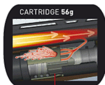
ACTIVE VALVE SYSTEM