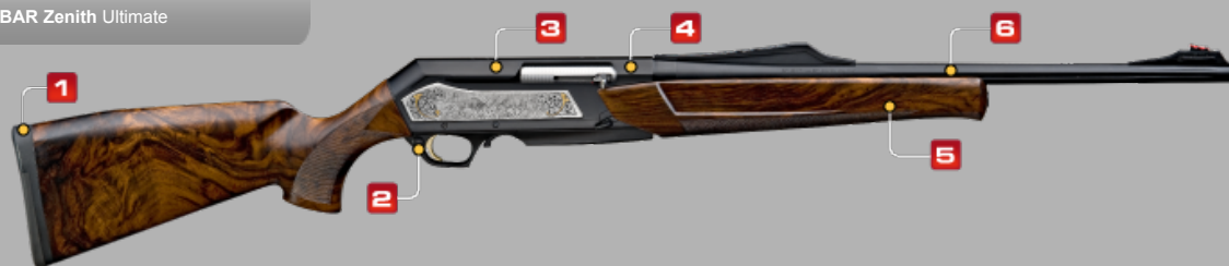
BAR Zenith Ultimate

Leader incontesté avec une expérience de 46 ans, Browning est le spécialiste de la carabine semi-automatique. Ce titre, elle le doit à la qualité de son mécanisme, à la douceur de son fonctionnement par emprunt de gaz qui réduit au maximum la sensation de recul, à sa fiabilité mais aussi et surtout au fait qu'elle a constamment évolué pour vous offrir des performances toujours accrues.